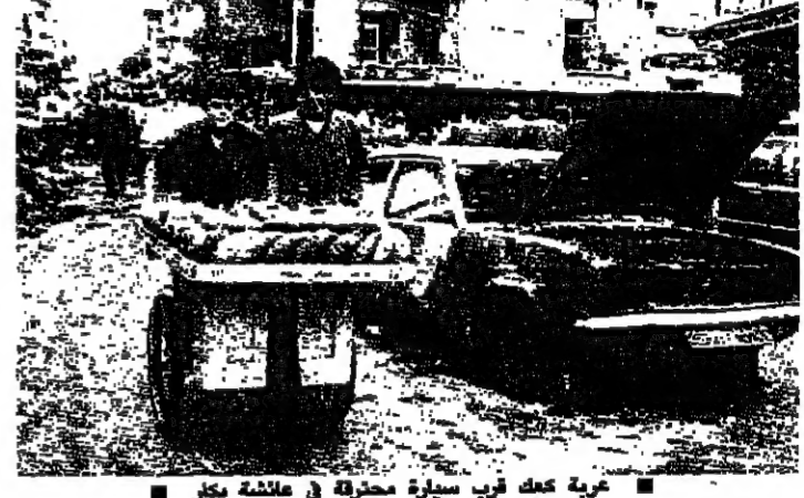
عربة عمه قرب سيارة محترقة في عيشة بكر